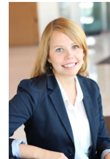
Frida Main Medpåskrivande revisor